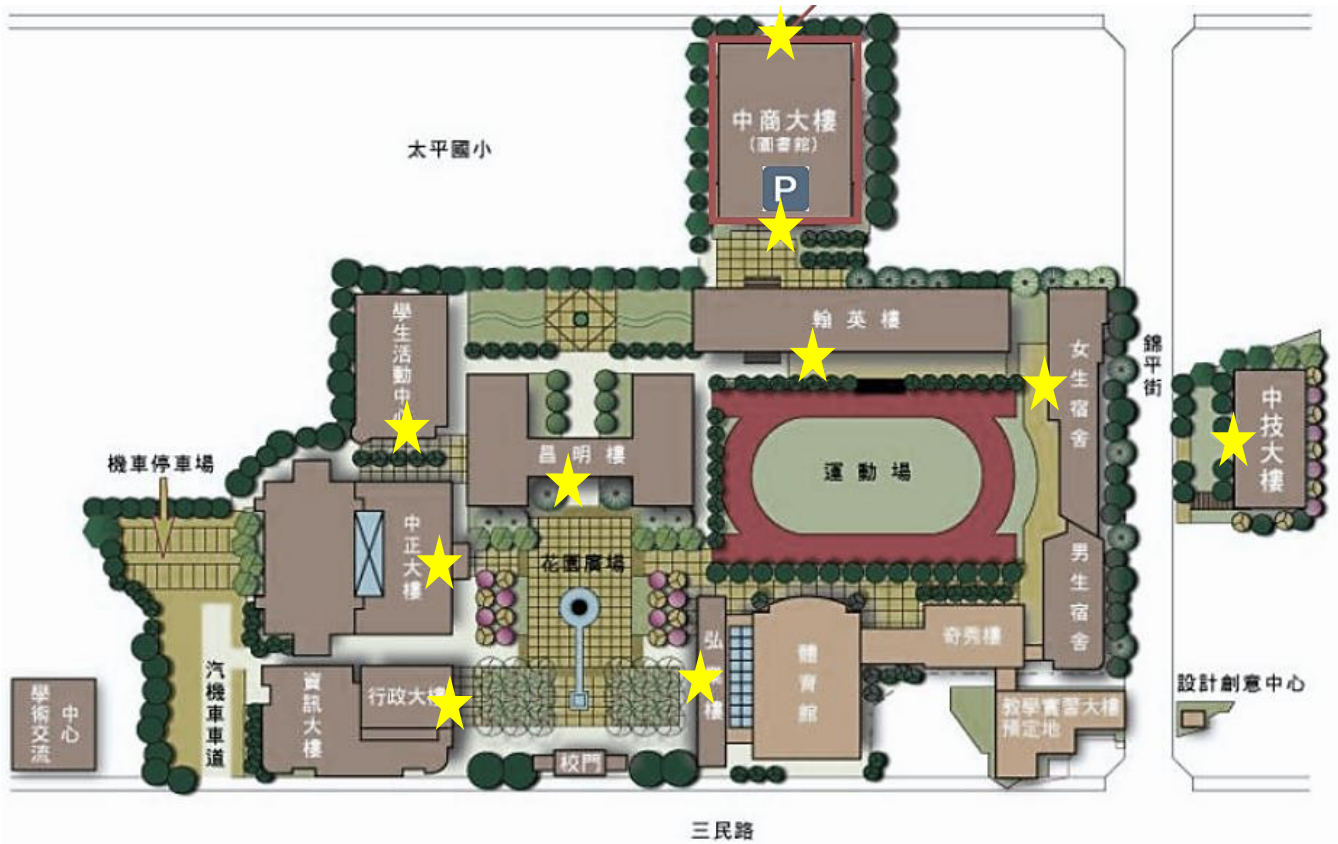
▲雨天備案位置圖(備用)