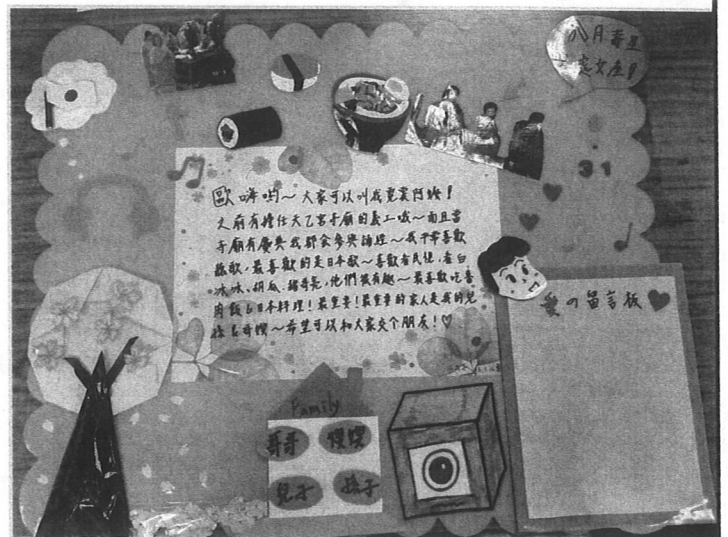
照片主題: 床頭卡成品