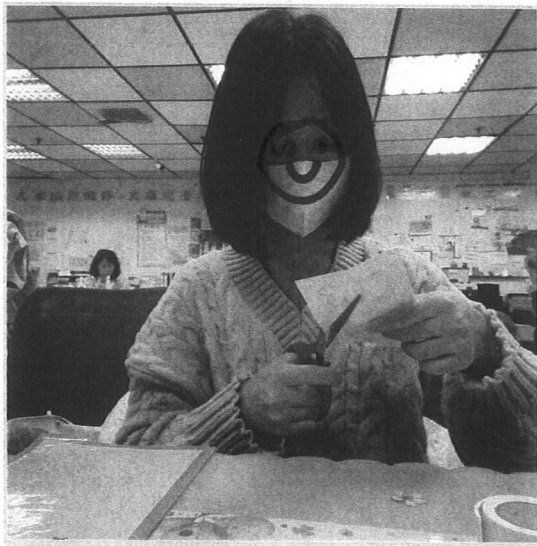
照片主題: 植物人床頭卡製作