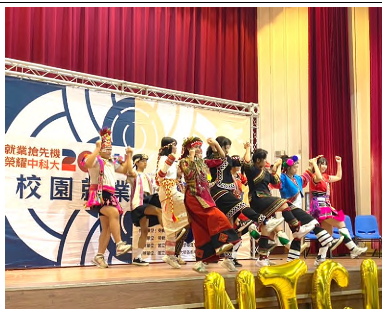
開場表演—Laaljjs 拉阿利斯社