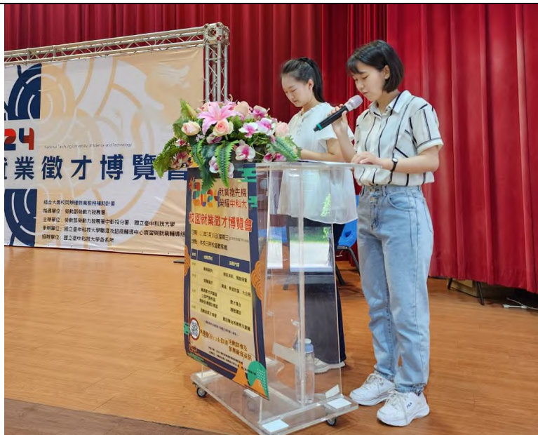
開幕式司儀—主持社