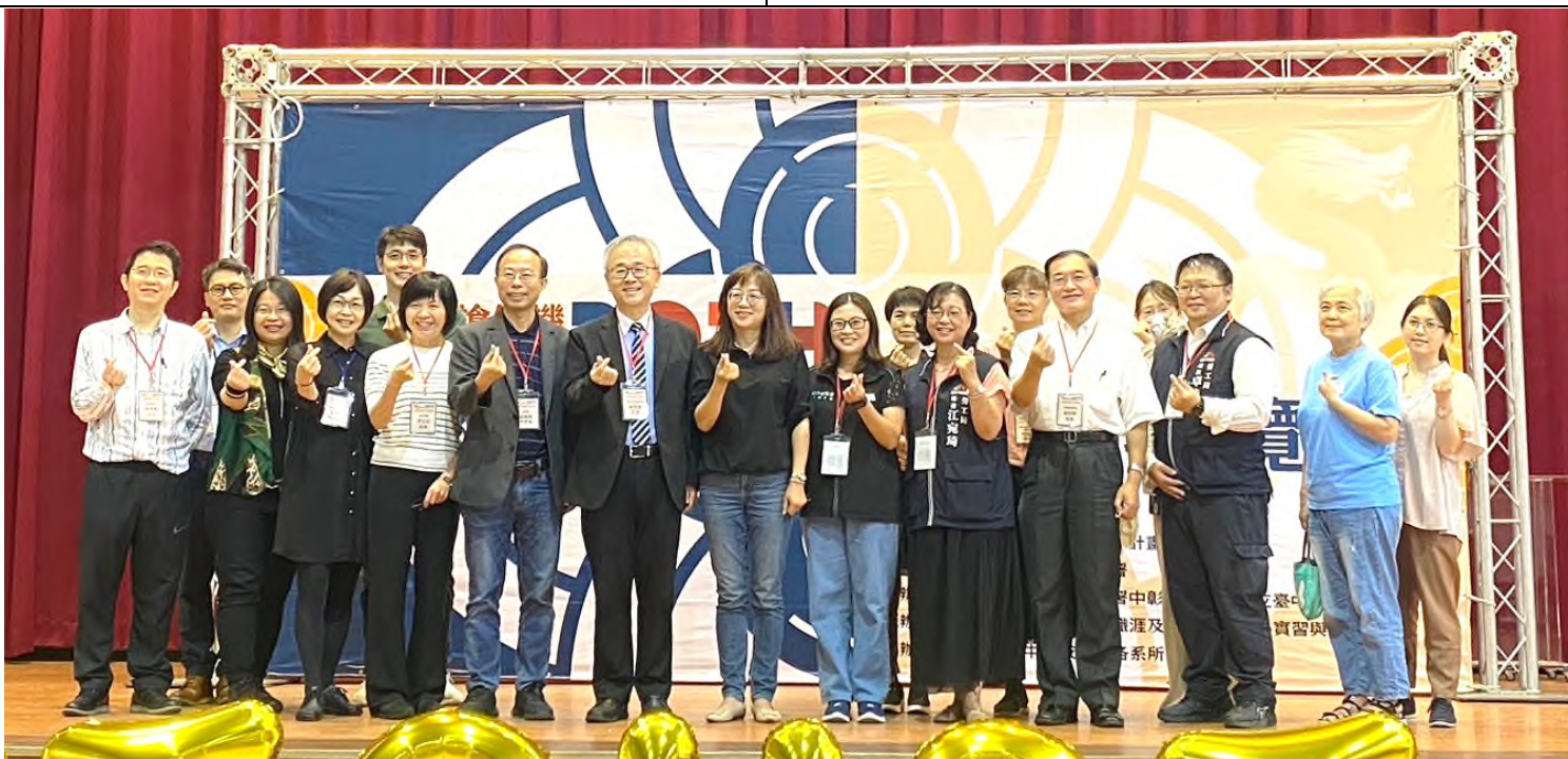
與會貴賓及本校職涯及諮商輔導中心同仁大合照