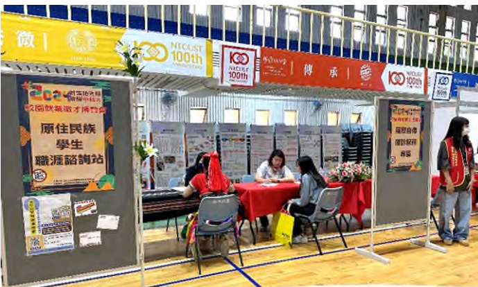
履歷自傳健診專區