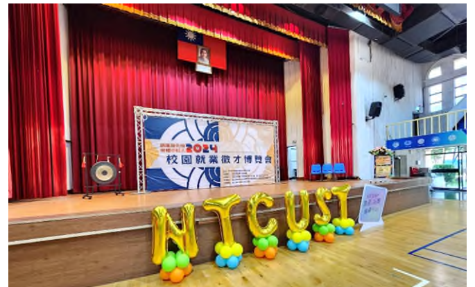
活動舞台場地佈置