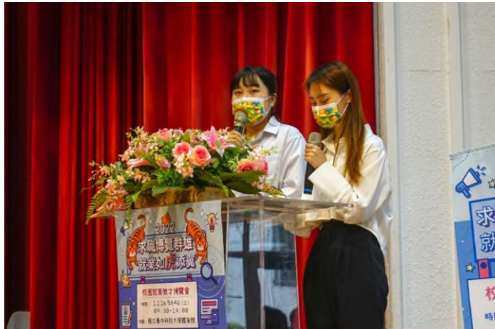
開幕式司儀－主持社