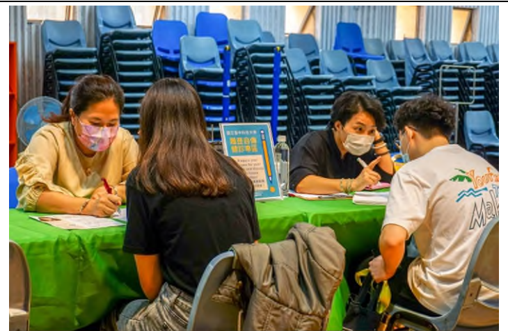
履歷自傳健診專區