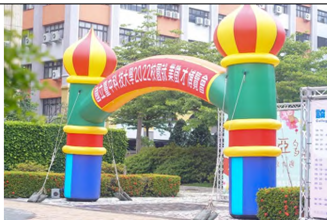
活動場地佈置－校門口設置氣球拱門