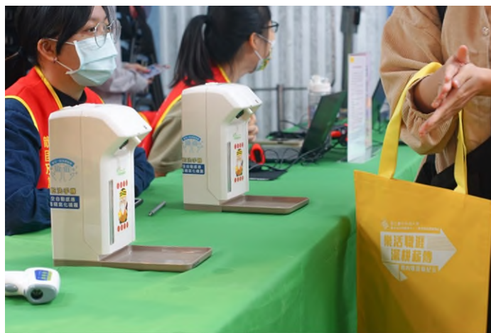
現場防疫措施及刷卡簽到區