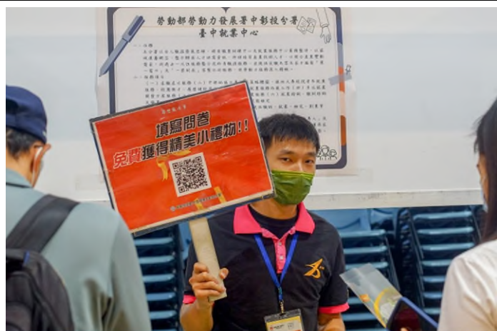
公部門服務區－臺中就業中心