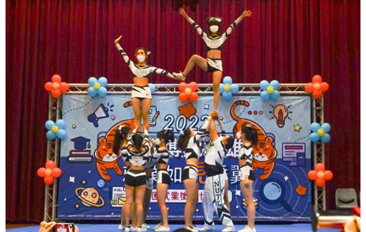
開場表演－競技啦啦隊