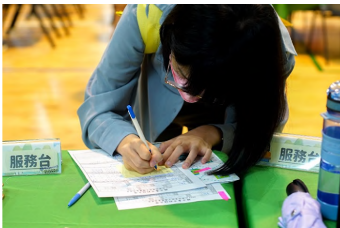
服務台代收學生履歷予線上參與廠商