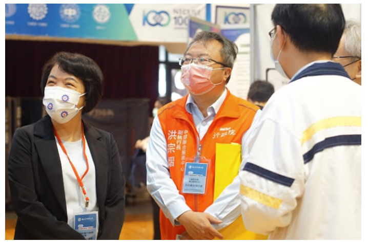
與會貴賓蒞臨活動現場