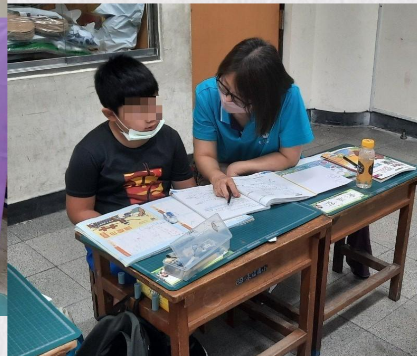
臺大徐教授蒞班關心學童課輔